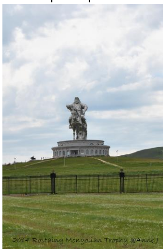
Statut de Gengis Khan

Rencontre avec l'équipe mongole (champion d'athlétisme) et des équipes française de France, Thaïlande . Je suis seule ainsi que Dominique (Parisien) a faire équipe avec deux mongoles, devant la difficulté a se faire comprendre avec les mongoles, nous décidons avec Dominique de faire équipe et de prendre une Mongole pour la maîtrise du cheval avec l'accord de la direction. Au final 6 équipes de trois participants avec deux 2quipes Mongoles, quatre françaises dont une de Thaïlande.