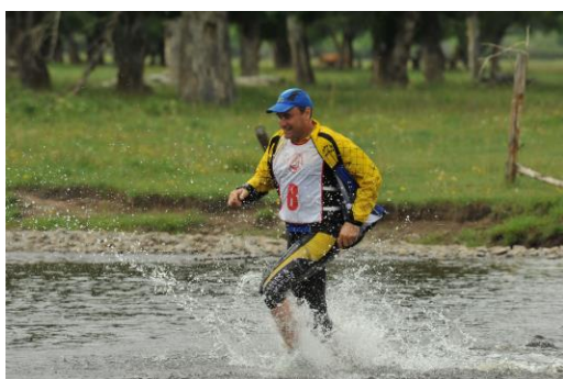
on traverse 3 à 4 fois par jour des rivières où marrai cage

Dernier jour 30 km, je commence en courant (11 km) avec une centaines de mouches autour de moi qui m'accompagne, Dominique me laissera le vtt au 1er PC, je le rattrape sur la dernière côte qui fait facilement 2.5 km, à l'arrivé les 3éme jouent le bonus d'une heure qui est de franchir en même temps pour l'équipe la ligne d'arrivé, cela ne change rien, Boodro a mis 45 minutes de moins que leur cheval, Dominique 20minutes de moins et moi 10.